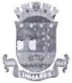
imagem em anexo que justifica tal demanda.

Entendemos que se trata de assunto urgente , por isso, tal proposição merece endereçamento imediato por parte da Prefeitura Municipal.