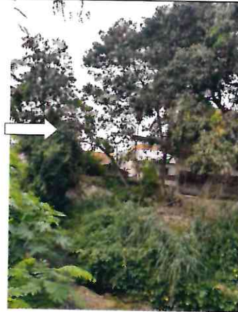
Figura 2 – Leucenas em situação de risco.