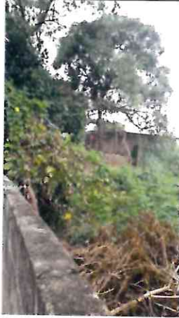
Figura 1 – Mangueira próxima ao muro que já desabou parcialmente devido às chuvas ocorridas no mês de março.

Ref. OF/COMPDEC/015/2021 – Solicitação de vistoria técnica e providências cabíveis com relação a uma árvore.