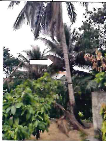
Figura 3 – Coqueiro muito alto com pouca sustentação no solo.